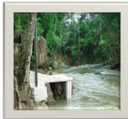
Reglas graduadas en las riberas del río Cabra.