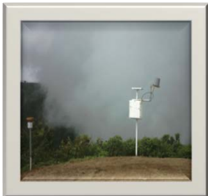
Estación meteorológica satelital en Cerro Pelón

En tal sentido, fueron instaladas: una estación meteorológica satelital en Cerro Pelón, en la parte más alta de la cuenca; una estación hidrológica satelital en Rancho Café que registra niveles del Río Cabra y lluvia, en la riberas de la parte media del río Cabra; y juegos de reglas graduadas en unidades métricas para darle seguimiento al nivel del río Cabra, en Rancho Café, en el puente al lado del rancho El Manantial cerca del puente colgante (zarzo), y en el área del puente de la carretera Interamericana. Este SAT favorecerá a las comunidades Nueva Esperanza, Barriada Arnulfo Arias Madrid, Barriada Caminos de Omar, Prados del Este, entre otras.